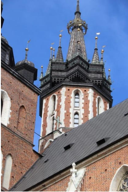
Basilique Notre-Dame Cracovie actualité.

Après une bonne nuit et un petit déjeuner consistant, nous partons à pied pour la visite guidée du cœur de la vieille ville de Cracovie avec la place du marché, la halle aux draps, la barbacane.